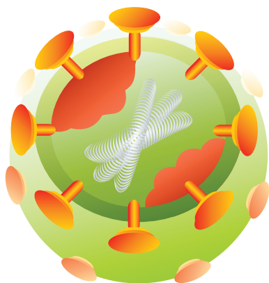
Вирус иммунодефицита человека

В отличие от микробов, вирусы не могут питаться и размножаться без участия клеток других живых существ. Они им нужны как «инкубаторы» для продолжения